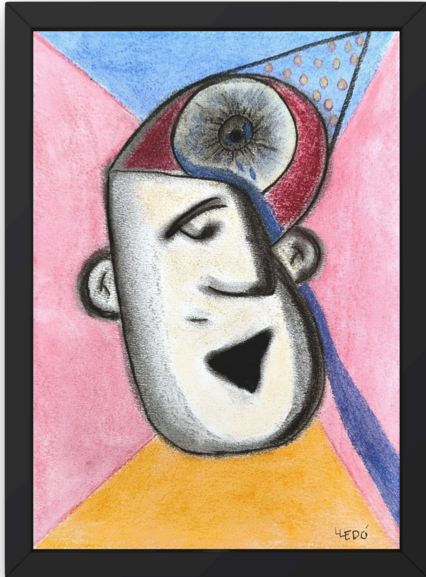
RÍO DE LÁGRIMAS (2025) Carboncillo y pastel sobre papel 21 × 29,7 cm

Sensibilidad llevada al límite. Observar se convierte en una forma de sufrimiento.